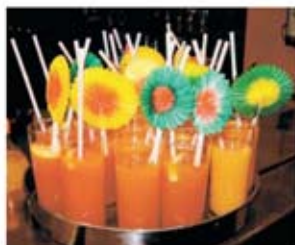
Kokтели za najmlađe

■ Dječji barmen koji nudi koktele, više koje govore engleski i francuski ili projekcije filmova samo su neke mogućnosti za proslavu dječjeg rođendana